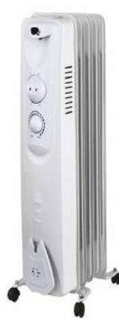
Radiator eléctrico 05

1000W potencia 31x17x66 cm medidas 7,8 kg peso 3 niveles de potencia triple mecanismo seguridad termostático control temperatura