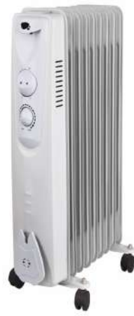
Radiator eléctrico 09

2000W potencia 47x17x66 cm medidas 12,8 kg peso 3 niveles de potencia triple mecanismo seguridad termostático control temperatura