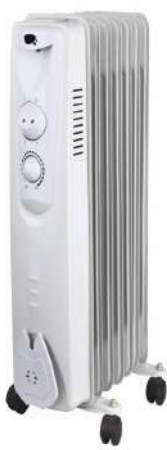
Radiator eléctrico 07

1500W potencia 39x17x66 cm medidas 10,2 kg peso 3 niveles de potencia triple mecanismo seguridad termostático control temperatura