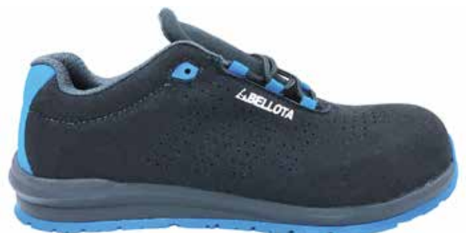
ZAPATO SERRAJE INDUSTRY NEGRO-AZUL S1P