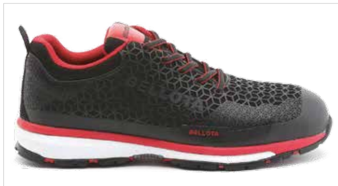
ZAPATO CELL NEGRO 72223B S3 NM No Metálicas

Microfibra hidrofugada S3 resistente a la penetración y absorción de agua. Puntera de seguridad y plantilla antiperforación no metálicas. Suela Bidensidad Goma + EVA. Inserto de TPU en el enfranque para evitar la torsión del pie y dotar de estabilidad a la pisada. Collarín acolchado, lengüeta en fuelle EXTRA acolchada y plantilla interior conformada ergonómicamente para mayor comodidad y ajuste. Forro EXTRA acolchado Bellota Mesh 3D. Horma ancha.