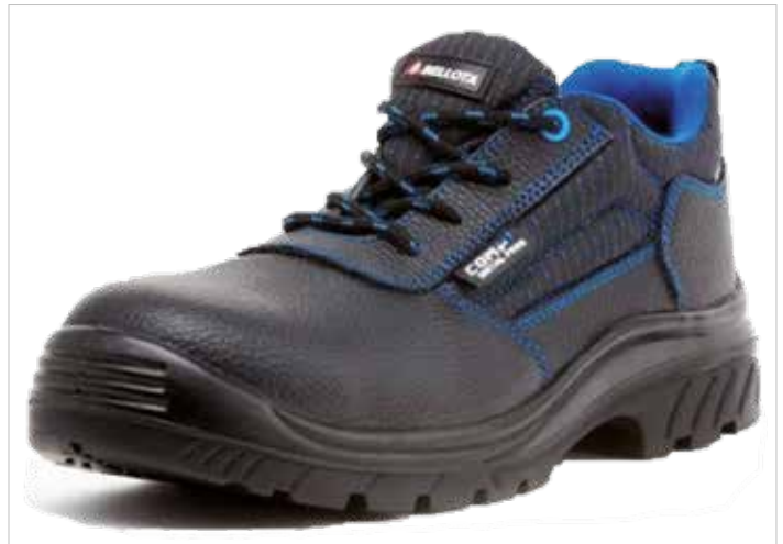
ZAPATO PIEL NEGRA Y AZUL 72308 S3 NM No Metálicas

Collarín acolchado, lengüeta en fuelle. Forro acolchado Bellota Mesh: mejor ventilación y mayor comodidad. Horma ancha.