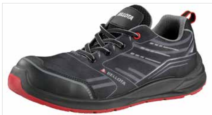
ZAPATO FLEX AIR NEGRO Y ROJO S1P NM No Metálicas