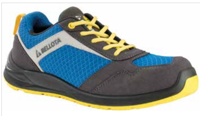
ZAPATO AZUL Y AMARILLO NITRO S1P NM No Metálicas

Microfibra hidrofugada S3 resistente a la penetración y absorción de agua. Puntera de seguridad y plantilla antiperforación no metálicas. Suela Bidensidad Goma + EVA. Inserto de TPU en el enfranque para evitar la torsión del pie y dotar de estabilidad a la pisada. Collarín acolchado, lengüeta en fuelle EXTRA acolchada y plantilla interior conformada ergonómicamente para mayor comodidad y ajuste. Forro EXTRA acolchado Bellota Mesh 3D. Horma ancha.