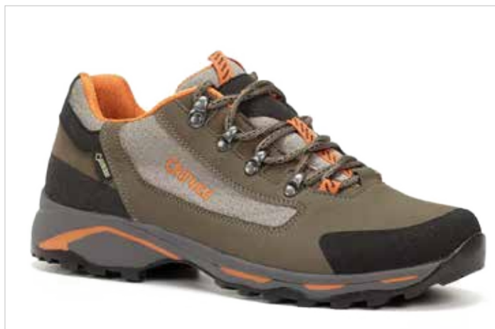
ZAPATO DEPORTIVO SANTIAGO PRO 08 GORE-TEX

Zapatilla en color fucsia para mujer de la marca Chiruca, fabricada con material textil y paneles sintéticos termo sellados, forro interior textil y plantilla extraíble para una mayor higiene. Tecnología Gore-Tex Extended Comfort que proporciona una comodidad y una protección máximas en una amplia gama de actividades y condiciones climáticas. Entre suela phylon Expanso y suela Vibram que amortigua y absorbe los impactos de cada pisada.