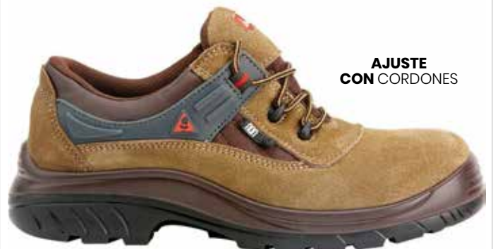
AJUSTE CON CORDONES