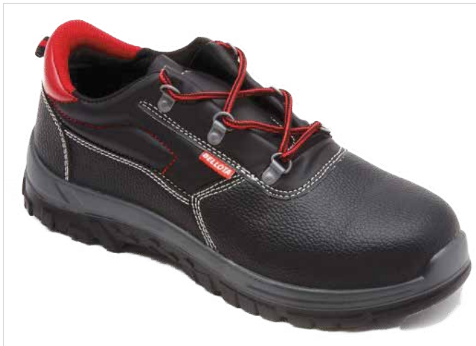
ZAPATO PIEL NEGRA Y ROJO 72301 S3

Zapato de seguridad SUPER ECONÓMICO con certificado en Categoría II según norma EN ISO 20345:11. Puntera y plantilla metálicas. Suela Bidensidad PU + PU: máxima prestación antideslizamiento -SRC. Canales anchos, zonas de frenado, absorción de impactos, Corte de piel S3. Collarín acolchado y lengüeta en fuelle.