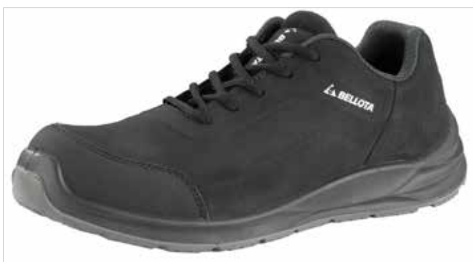
ZAPATO NEGRO CARBÓN FLEX S3 NM No Metálicas

Flexibles: La nueva suela FLEX está diseñada para doblarse y adaptarse a las posiciones más incómodas. Absorben los impactos: El binomio de la suela FLEX con la nueva plantilla CONFORT+ es la combinación de comodidad perfecta. El efecto "acordeón" de la suela junto con la plantilla compuesta de células abiertas de poliuretano llegan a absorber más del 50% de la energía de impacto, dando la sensación de calzado deportivo. Ligeras: Materiales ligeros como la puntera de fibra de vidrio para sentir que no llevas calzado de seguridad. Certificación ESD para descargar la carga estática de tu cuerpo y evitar chispazos o explosiones. Zapatilla ideal para aquellos que busquen un calzado ligero, polivanlente y con toque de color. Para el profesional de la construcción, industria, instalaciones o servicios.