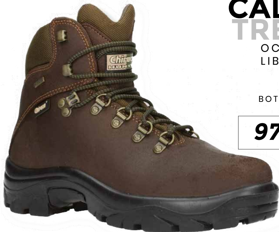
BOTA POINTER MARRÓN 02 GORE-TEX