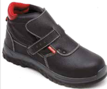
BOTA SOLDADOR VELCRO S3

Bota de seguridad con cordones fabricada en materiales de resistencia y durabilidad extraordinaria. Horma ergonómica y extra ancha, que ofrece un ancho especial y gran estabilidad. Piel Flor Natural 1ª calidad Hidrofugada. Suela reforzada antitorsión de máxima ligereza. Planta textil antiperforación con puntera plástica anti-impactos. Lengüeta tipo fuelle. Forro interior de alta resistencia.