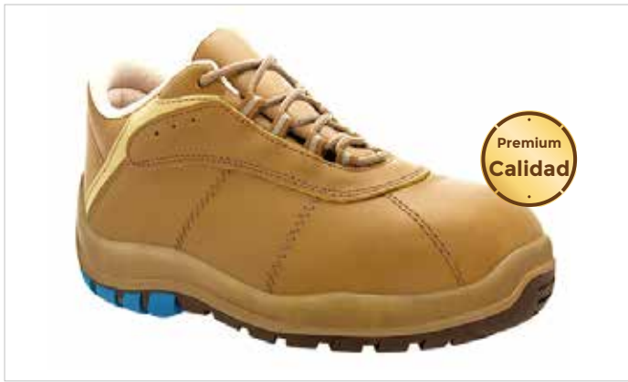
ZAPATO PIEL CUERO No SILVERSTONE S3 NM Metálicas