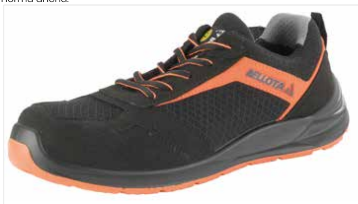
ZAPATO NEGRO Y NARANJA NITRO S1P NM No Metálicas