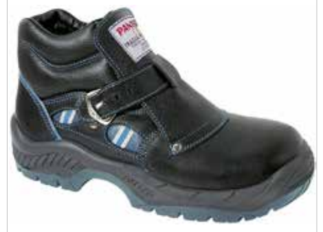
BOTA FRAGUA PLUS S2