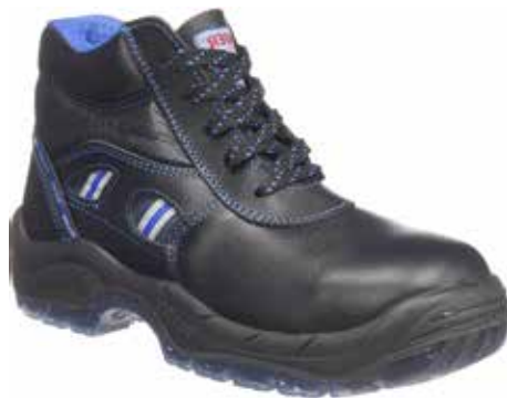
BOTA SILEX PLUS NEGRO S3

Collarín acolchado, lengüeta en fuelle. Forro acolchado