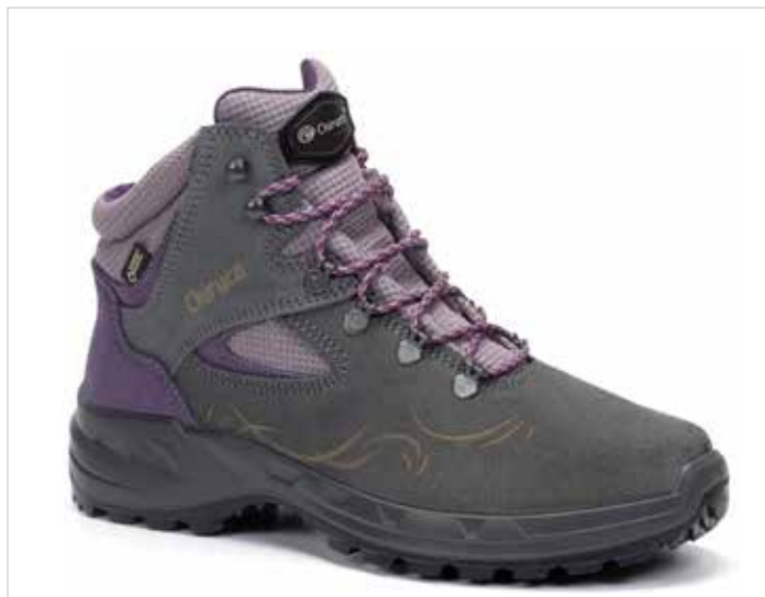
BOTA SARRIA 06 GORE-TEX

Botas técnicas para Trekking perfectas para largas marchas en la naturaleza o trabajos al aire libre, fabricada en piel serraje natural. Calzado transpirable especial para montaña. Extra comodidad, flexibilidad y estabilidad. Resistencia y durabilidad extraordinaria. Plantilla termoconformada, anatómica, antiestática y antibacteriana, resistente a la abrasión. Suela antitorsión diseñada para terrenos abruptos en caucho nitrilo resistente a altas temperaturas (300°C). Eficaz aislante del frío y el calor extremo. Adherente a toda clase de superficies, proporciona tracción y estabilidad. Resistente a aceites e hidrocarburos. Acolchados antirrozaduras.