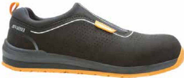
ZAPATO SERRAJE INDUSTRY EASY NEGRO-NARANJA SP1

Zapato en piel perforada, suela PU bidensidad antideslizamiento, parte frontal sin costuras para reducir el riesgo de roturas y garantizar una mayor seguridad. Puntera y lámina de acero.