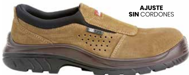
AJUSTE SIN CORDONES

USOS: Especialmente indicado para realizar trabajos en el exterior que requieran llevar calzado de seguridad