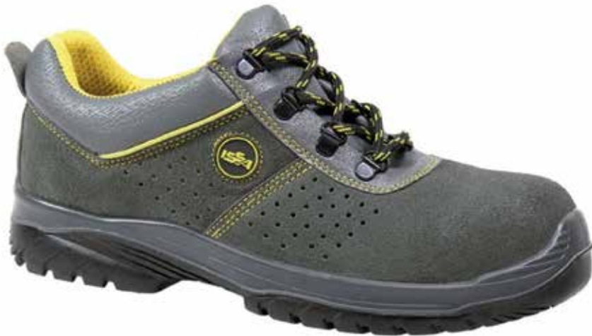
ZAPATO SERRAJE GRIS AMARILLO TIRSO S1P SRC