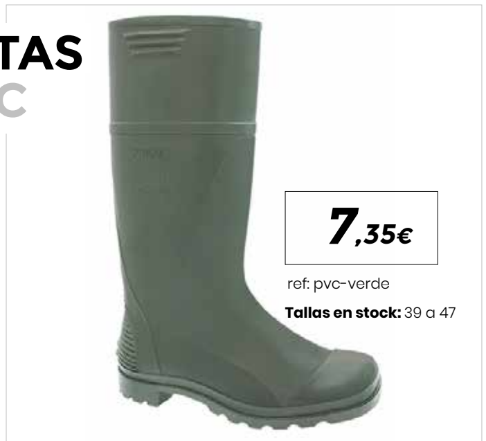
BOTA PVC VERDE