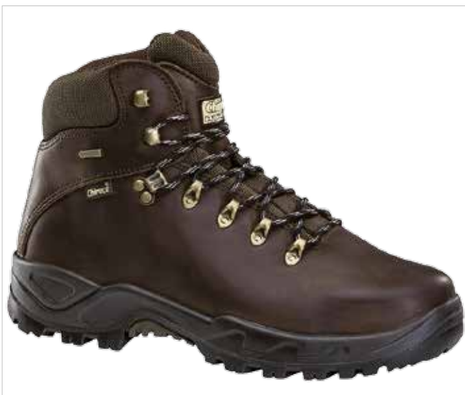
BOTA GALICIA 02 GORE-TEX

Un modelo clásico, todoterreno y polivalente para todas las condiciones y terrenos. Con él tienes garantizado unas botas muy resistentes, de gran calidad y muy duraderas en el tiempo. Por supuesto, llevan forro Gore-Tex, para una completa impermeabilidad de tus pies. Este forro es 100% transpirable y 100% impermeable. Fabricadas en piel de serraje hidrofugada (repele el agua). Son unas botas perfectas para cualquier temporada del año, haga frío o calor, ideales para rutas senderistas de alta y media montaña. Muy cómodas y flexibles, ideales para estar todo el día con ellas puestas. Llevan una entresuela fabricada por dos densidades de poliuretano y un semiestabilizador de la pisada. Consiguiendo además, una excelente combinación de ligereza, absorción de impactos y aislamiento térmico.