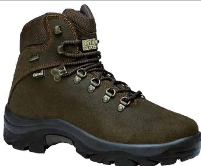
BOTA POINTER VERDE 01 GORE-TEX