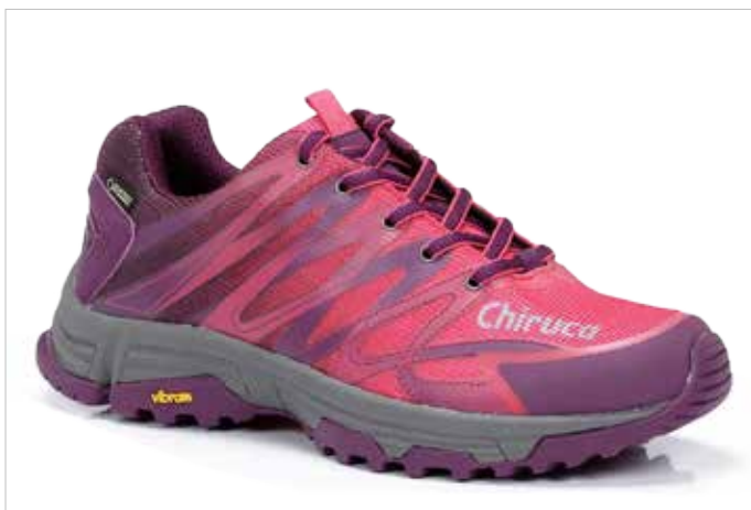
ZAPATO MULTIFUNCION MARBELLA 09 GORE-TEX

Botas senderismo mujer Sarría 06 GTX de la marca Chiruca. Suela Poliuretano X-TRA de gran durabilidad y agarre extremo. Incorpora forro Gore-Tex, proporcionando impermeabilidad y transpirabilidad. Piel serraje hidrofugada. Grabado a láser. Suela de poliuretano bidensidad Xtra Sport. Peso 448 gramos