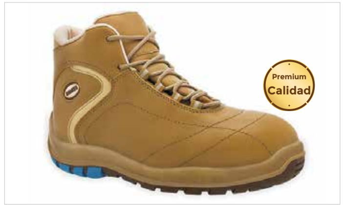
BOTA PIEL CUERO No MONZA S3 NM Metálicas

ref: 2700-silverstone Tallas en stock: 39 a 45