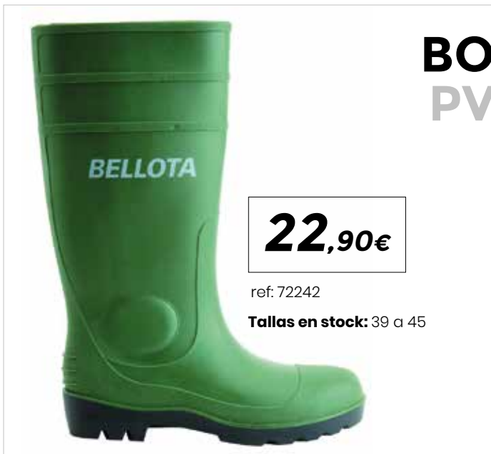
BOTA PVC VERDE HYDRA S5

Zapato Silverstone y Bota Monza de seguridad con cordones, de máximo confort y bienestar, desarrollada con materiales Premium de 1ª calidad . Atractiva estética y diseño de vanguardia, apto para dentro y fuera del trabajo. Piel flor natural 1ª calidad hidrofugada, escogida por su calidad, resistencia y capacidad transpirable. Protección y confort para todo el día. Horma ancha y Ergonómica, se ajusta perfectamente al pie con extraordinaria comodidad, flexibilidad y estabilidad. Suela PU+TPU que mejora el agarre, tracción, amortiguación y flexibilidad. Puntera de aluminio anti-impactos (200J) y planta textil antiperforación (1100N). Forro termorregulador resistente a la abrasión. Plantilla interior termoconformada, tecnología PANTER TRI-TEC. Absorción de energía en el talón. Sistema de atado rápido sin ojetes. Lengüeta confort acolchada.